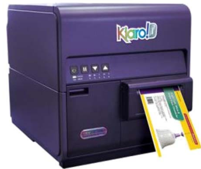
Kiara! D mit 105mm Druckbreite